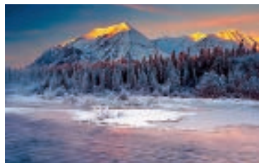
Franz Bagyi – Naturfotografie