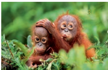
Konrad Wothe – Faszination Regenwald