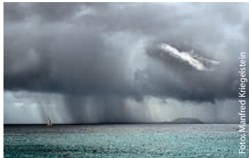
Manfred Kriegelstein – Lanzarote

Lanzarote Hahnemühle-Stand ► manfred-kriegelstein.de