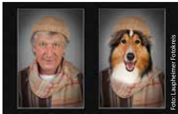
Laupheimer Fotokreis – Hund und Mensch

Bildjournalismus Saal www.sichtlichmensch.de