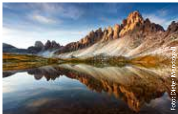
fotoforum Award – Highlights der Fotografie

Highlights der Fotografie Raum I www.fotoforum.de