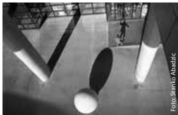
Stanko Abadzic – Street Photography

Street Photography Raum II und III www.abadzic.de.vu