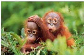
Konrad Wothe – Faszination Regenwald