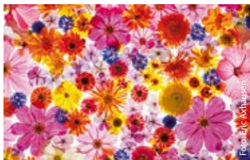
fotoforum Award – Highlights der Fotografie

„Highlights der Fotografie“ präsentiert ausgewählte Motive aus dem fotoforum Award. Die Ausstellung versammelt Arbeiten aus den Bereichen Landschaften, Tiere, Pflanzen, Architektur, Menschen und Experimentelles. Der fotoforum Award ist mit über 18.000 Einsendungen einer der erfolgreichsten Fotowettbewerbe im deutschsprachigen Raum.