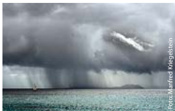
Manfred Kriegelstein – Lanzarote

Scheinbar real Eiskeller im Schloss Großlaupheim ► jft-creative.de