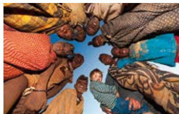
Josef Niedermeier – Afrika – Der Süden