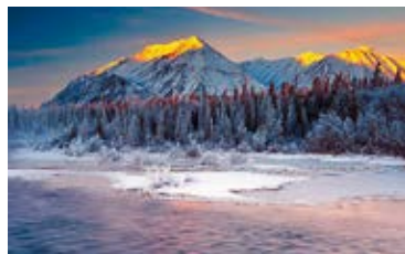
Franz Bagyi – Naturfotografie